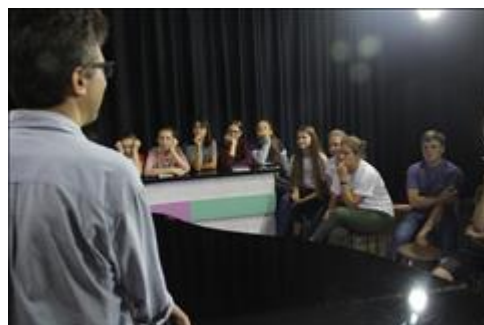
Четвертая стажировка Стажировка в телестудии "После школы", август 2018. Тренинг по работе в студии