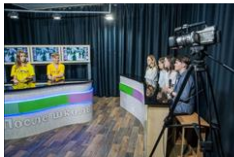
Вторая стажировка Стажировка в телестудии "После школы", май 2018. Тренинг по работе в телестудии