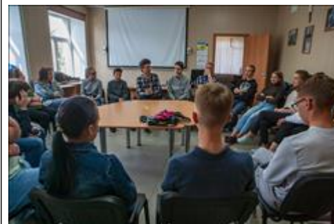
Третья стажировка Стажировка в телестудии "После школы", июнь 2018. Подведение итогов дня